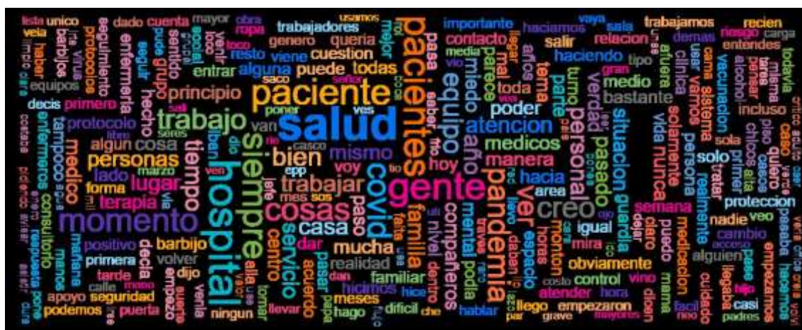
Figura 1. Nube de palabras a partir de las citas de todos/as los/as trabajadores/as.